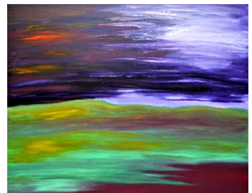
Peter Klak, Grün bis Violett

Mal- und Zeichenkurs Von den Grundlagen des Zeichnens bis zur freien Malerei