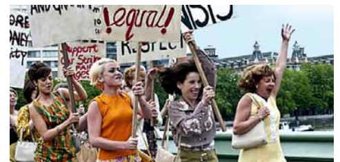
GB 2010/D 2011, 113 Min.