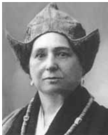
Alexandra David-Néel besuchte 1924 Lhasa als tibetische Nonne verkleidet

Die Reisenden, die wir kennen lernen werden, sind wagemutig und oft genug skurril: so reist Fürst Pückler-Muskau mit eigenem Koch in die ägyptische Wüste und Goethe wird am Gardasee während seiner „Italienischen Reise“ beinahe als Spion verhaftet. Geradezu unglaublich ist der Mut Alexandra David-Néels, sich als Frau nach Tibet zu wagen, und bewundernswert ist die Kraft, die Alexander von Humboldt aufbietet, um Südamerika zu erforschen.