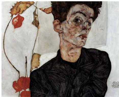
Egon Schiele, Selbstportrait mit Physalis

Eine bizarre Gebärdensprache und eckige Formen in expressiver Übersteigerung kennzeichnen die Bildsprache des bedeutenden Vertreters des Wiener Expressionismus, Egon Schiele. Mit psychologisch aufgeladener Linie und symbolhafter Farbigkeit stellte er den menschlichen Körper und seine Gestik dar. Im Alter von nur 28 Jahren starb Schiele 1918.