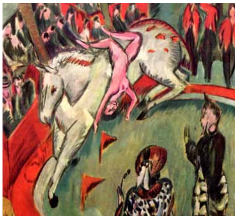
Ernst Ludwig Kirchner: Die Zirkusreiterin

Anlässlich der Ausstellung in Baden-Baden 2018/19