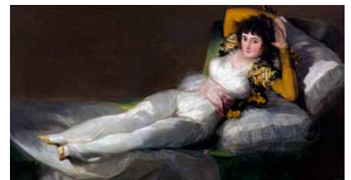
Francisco de Goya, Die bekleidete Maya

In seinem Spätwerk tritt das Fantastische zu Tage, das die Moderne des 20. Jh. inspirierte.